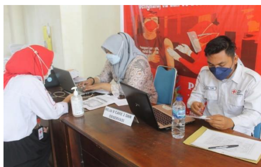
Gambar 3. Pemberian vaksinasi