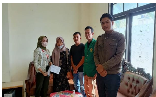
Gambar 2. Kegiatan pelatihan maintenance