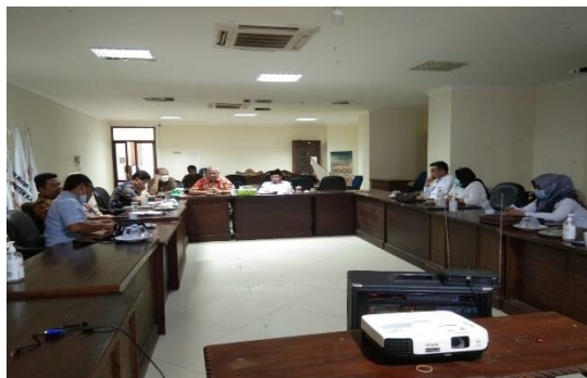
Gambar 1. Kegiatan pelaksanaan pengabdian kepada masyarakat

yang terdiri dari carring, cleaning, dan Fixing,. Sedangkan kegiatan tambahan meliputi: membuat Tabel Masukan input data bantuan barang galang dana , bantu print Surat dan dokumen, membantu dalam acara Vaksinasi , membersihkan serta membantu dalam proses pindah barang dalam rangka perpindahan ke kantor PMI yang baru.