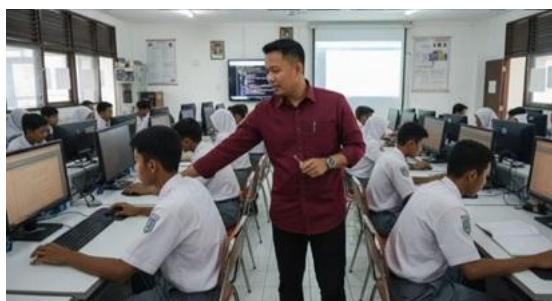
Gambar 1. Dokumentasi Kegiatan