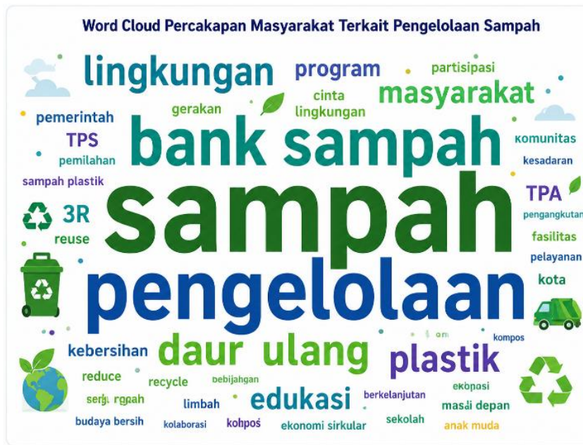
Gambar 3. Word cloud